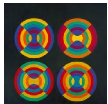
11. Herbert Bayer Four intersected circles, 1970/26 Lentos Kunstmuseum Linz, Stiftung Herbert Bayer © VBK, Wien, 2009