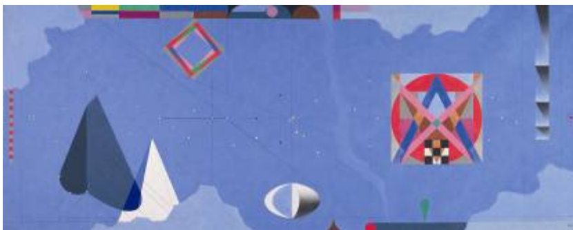
7. Herbert Bayer Suspended Secrets, 1979. Lentos Kunstmuseum Linz. © VBK, Wien, 2009