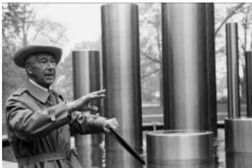
5. Herbert Bayer vor seiner Brunnenskulptur beim Brucknerhaus Linz, 1977