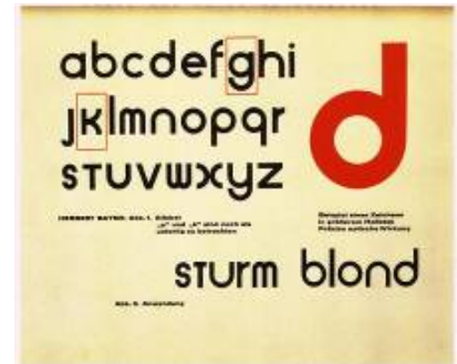
8. Herbert Bayer , Universal-Schrift in „Offset-Heft“, 1926, Bauhaus-Archiv Berlin