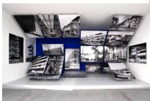
19-22. Ausstellungsansichten Lentos Kunstmuseum Linz