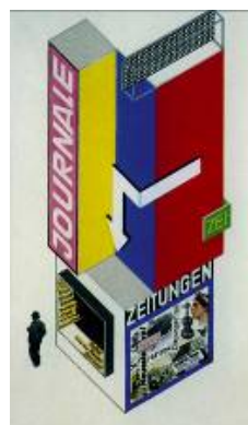
10. Herbert Bayer Kiosk für Zeitungsverkauf, 1924, Bauhaus-Archiv Berlin © VBK, Wien, 2009