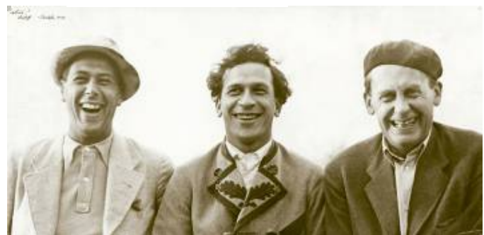
6. Herbert Bayer, Alexander Schawinsky, Walter Gropius, 1933