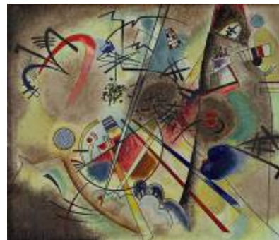
17. Wassily Kandinsky Kleiner Raum in Rot, 1925 Kunstmuseum Bern, Stiftung Nina Kandinsky © VBK, Wien, 2009