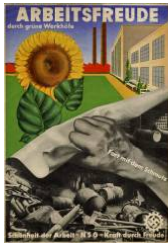
13. Herbert Bayer „Arbeitsfreude durch grüne Werkhöfe“, Werbeplakat, um 1937 Galerie Fricke, Berlin © VBK, Wien, 2009