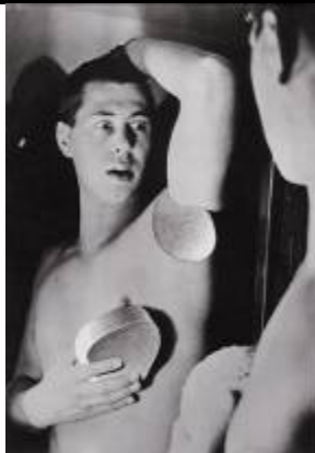
2. Herbert Bayer Selbstporträt, 1932 Lentos Kunstmuseum Linz