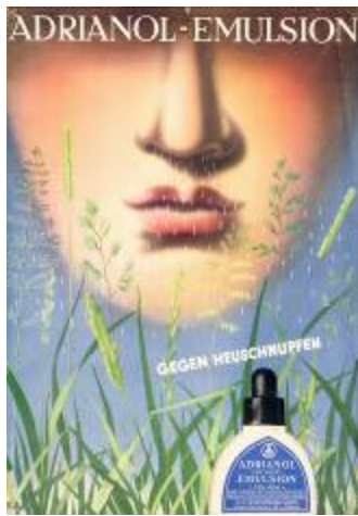
12. Herbert Bayer „Adrianol-Emulsion“, Werbeplakat, 1935 Lentos Kunstmuseum Linz, Stiftung Joella Bayer © VBK, Wien, 2009