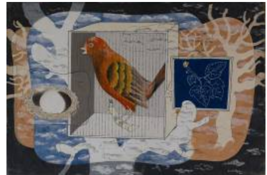
14. Herbert Bayer Bird with Egg, 1928 Collection Britt Bayer, Denver/Colorado