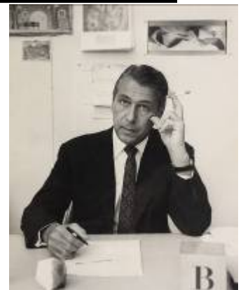
4. Herbert Bayer