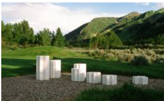
9. Herbert Bayer Anderson Park, 1973, Skulptur „Großer Wagen“ von Mathias Goeritz Aspen Institut, Aspen Meadows