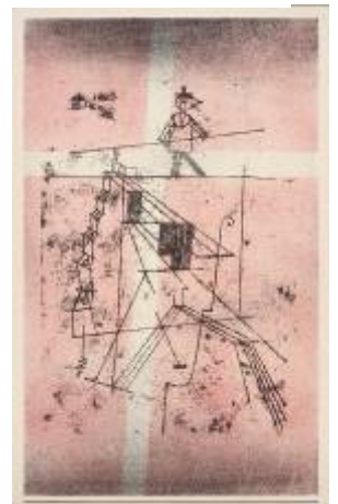
18. Paul Klee Seiltänzer, 1923 Lentos Kunstmuseum Linz