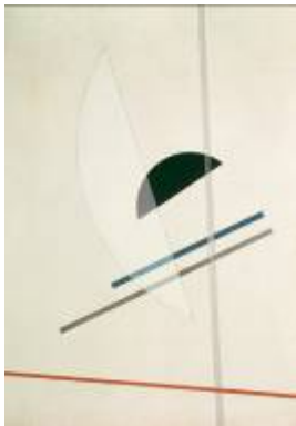
15. László Moholy-Nagy Komposition, 1922/23 Osthaus Museum Hagen Foto: Kühle © VBK, Wien, 2009