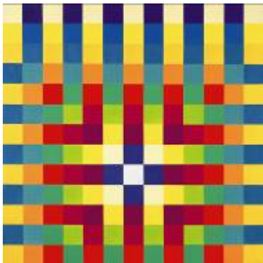
1. Herbert Bayer Polychrome warm and cool, 1970 Lentos Kunstmuseum Linz