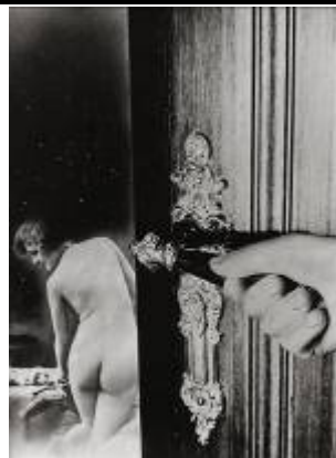
3. Herbert Bayer Good Night Marie, 1932 Lentos Kunstmuseum Linz, Stiftung Herbert Bayer