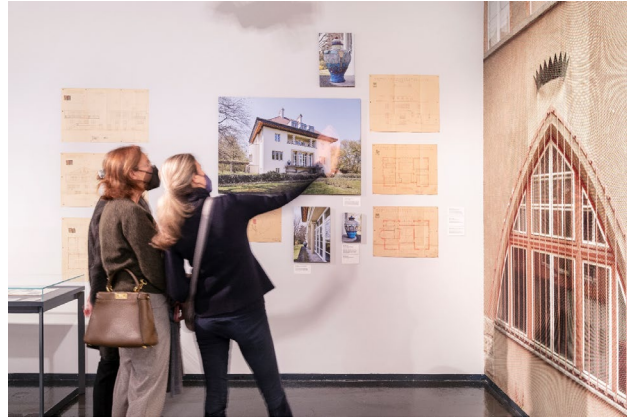
Abb. 1: Lentos Kunstmuseum Linz, Ausstellungsansicht „Friedl Dicker-Brandeis“, Foto: Bernhard Stadlbauer Abb. 2: Nordico Stadtmuseum Linz, Ausstellungsansicht „Gebaut für alle“, Foto: Violetta Wakolbinger

Honorarfrees Bildmaterial finden Sie hier zum Download .